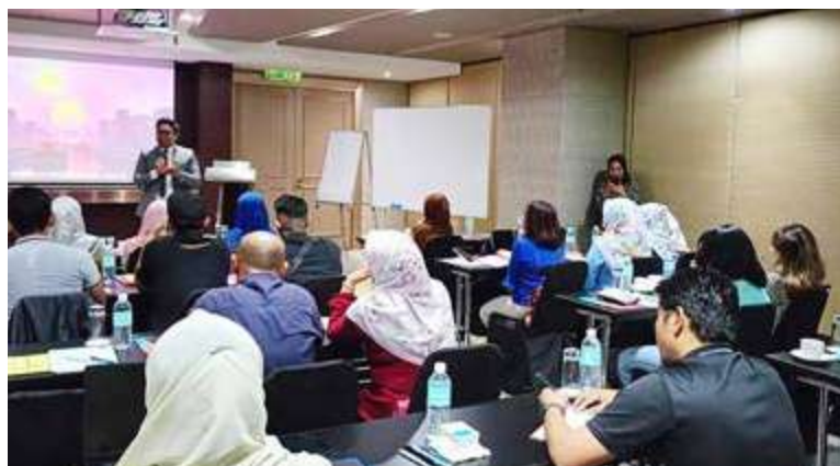
SEKITAR Bengkel Content Creator Usahawan Komuniti Putrajaya 2023.

Untuk sebarang pertanyaan dan maklumat lanjut boleh hubungi di talian 019-385 1544 (Perbadanan Putrajaya). WK