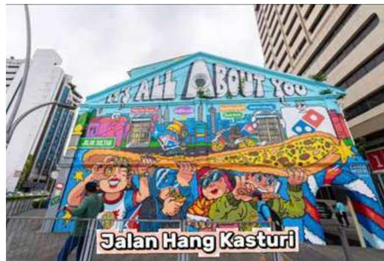
ANTARA mural yang menjadi perhatian terletak di Jalan Hang Kasturi.