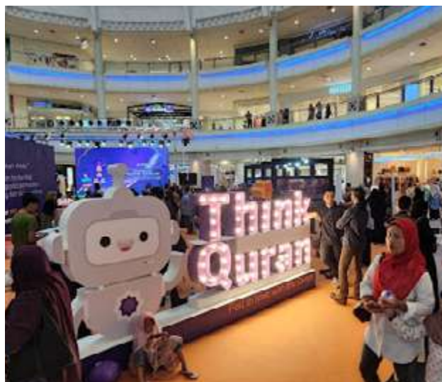
SEKITAR majlis pelancaran Think Quran di The Curve, Damansara tahun lalu.