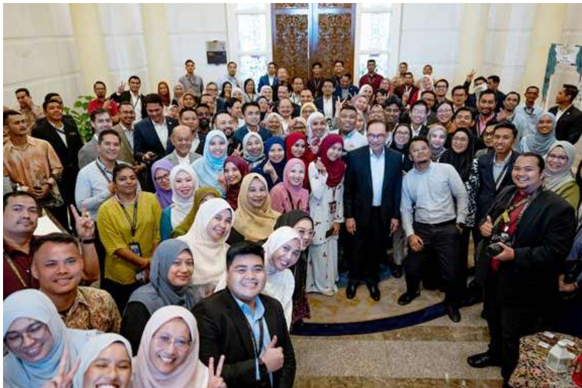
GAJI penjawat awam dikaji selain berusaha meningkatkan gaji pekerja swasta. - Gambar hiasan

mengkaji semula gaji penjawat awam dan usaha ini dilakukan untuk meningkatkan lagi produktiviti penjawat awam. Selain itu, kerajaan berusaha meningkatkan gaji pekerja swasta seluruh Malaysia menerusi pengenalan Dasar Gaji Progresif.