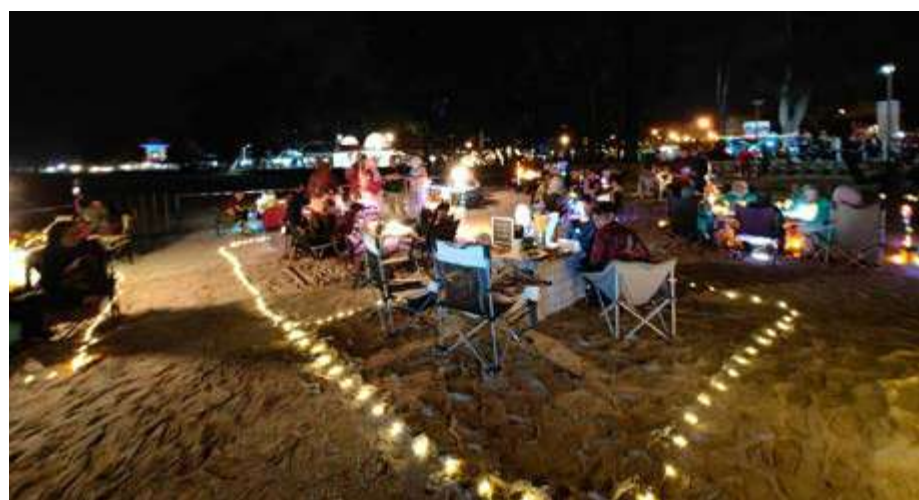
AKTIVITI yang julung kali diadakan berjaya mencatat sebanyak 250 penyertaan.