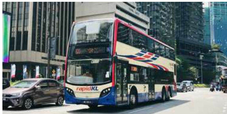
PROJEK percubaan lorong bas Jalan Genting Klang dan Jalan Ampang bantu lancar perjalanan lalu lintas.