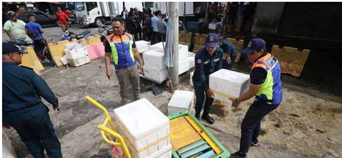
TINDAKAN operasi sentiasa diambil oleh DBKL bersama agensi penguatkuasaan lain. - Gambar hiasan

“Isu ini sudah lama dibangkitkan dan hampir setiap hari media melaporkan tindakan operasi, serbuan dan pemantauan diambil oleh DBKL bersama agensi penguatkuasaan yang lain. Walau bagaimanapun, isu ini dilihat tiada tanda noktah apabila peniaga tempatan sendiri yang memberi ruang dan peluang kepada golongan tersebut untuk menjalankan perniagaan.