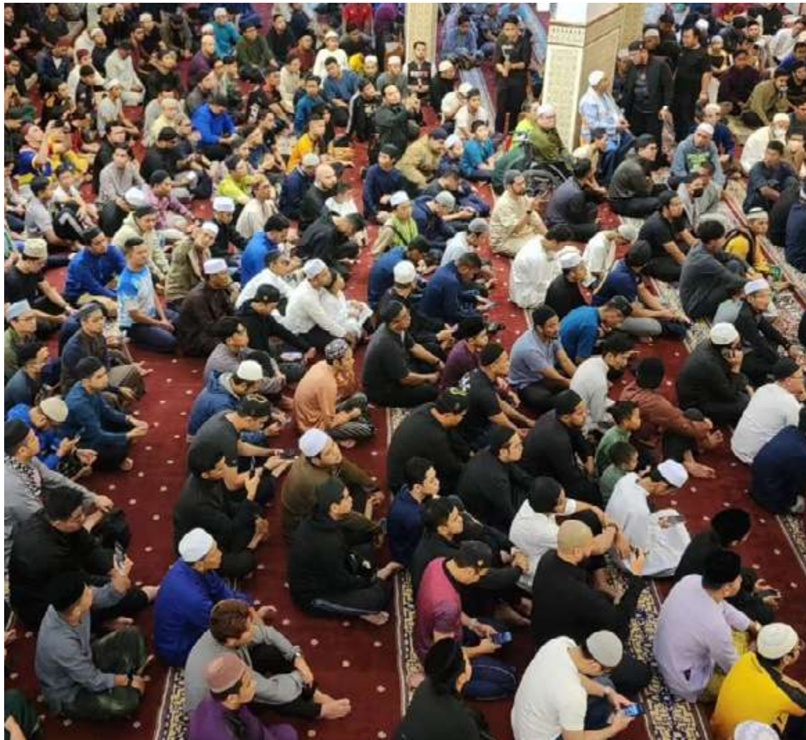
BERIBADAT adalah satu tuntutan dan tidak mengganggu orang lain juga adalah satu tuntutan. - Gambar hiasan

Lihat sahaja, berapa ramai orang hari ini merasakan mereka menghayati agama dan mengamalkan suruhan agama