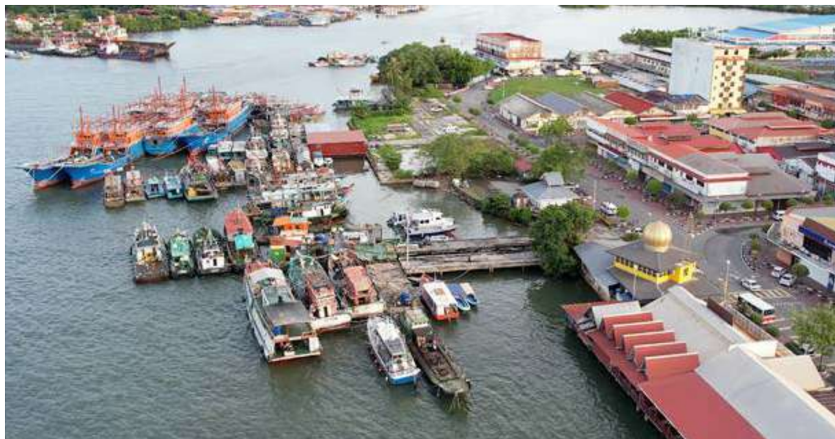
PEMBANGUNAN Labuan akan terus diberi penekanan.