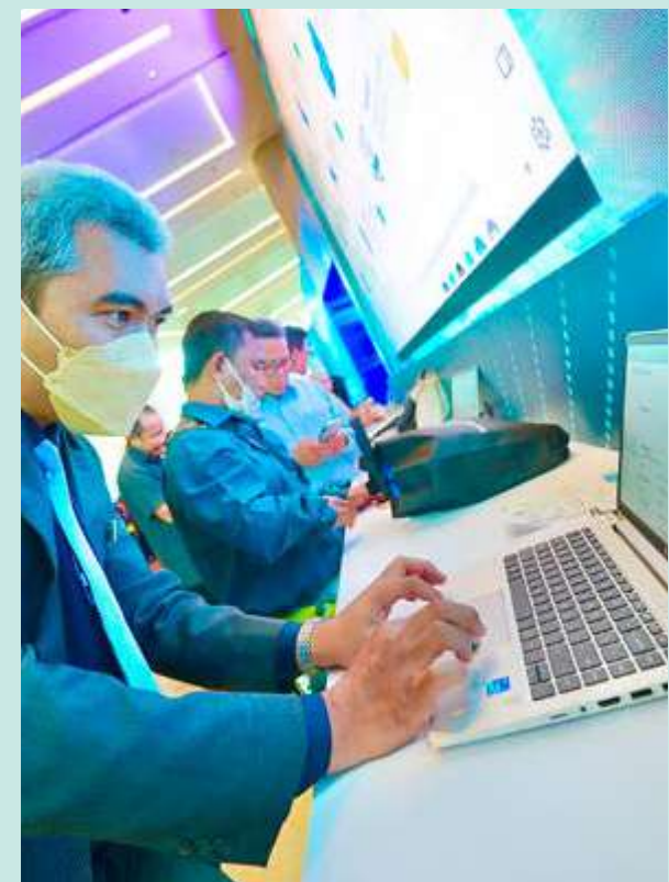
ORANG ramai boleh mula mengemas kini serta mengesahkan 39 item maklumat peribadi.

Pendaftaran di platform untuk memberi gambaran yang adil mengenai kedudukan sosioekonomi setiap isi rumah rakyat Malaysia itu dibuka kepada orang ramai mulai hari ini sehingga 31 Mac depan bagi mengemas kini serta mengesahkan 39 item maklumat peribadi seperti nombor kad pengenalan, bilangan isi rumah dan alamat. WK