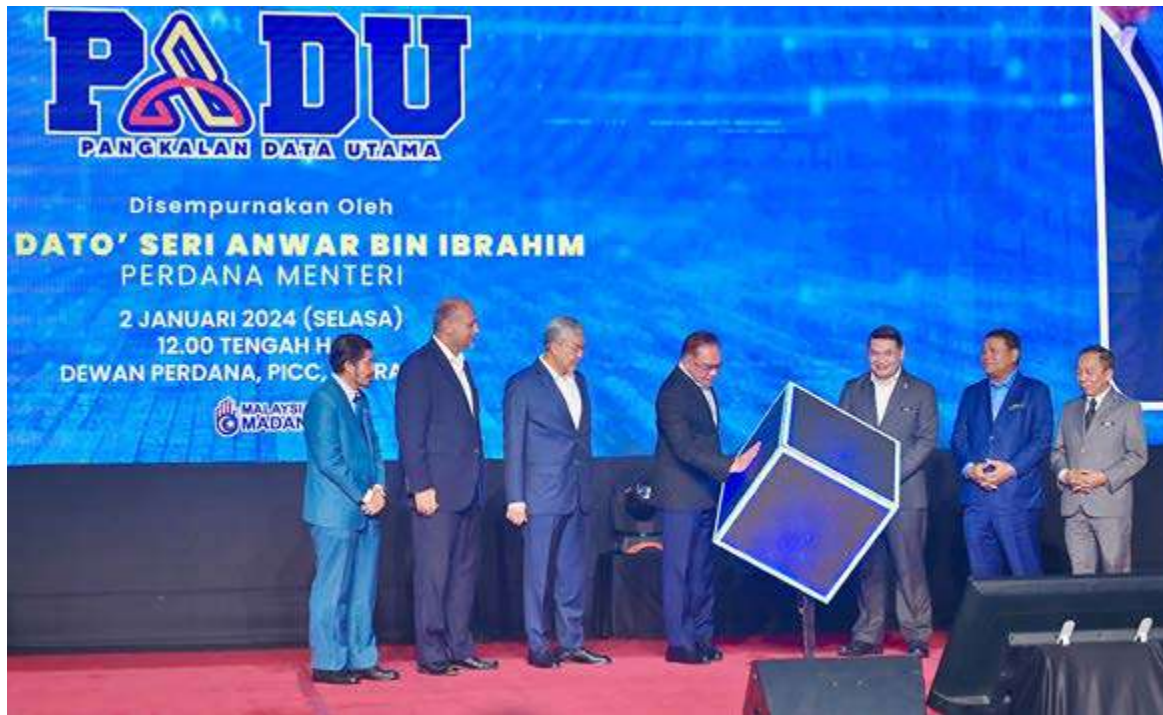
ANWAR (tengah) merasmikan Majlis Peluncuran PADU di Pusat Konvensyen Antarabangsa Putrajaya pada Selasa.

“Idea untuk membangunkan PADU telah dibincangkan semasa mesyuarat Majlis Tindakan Ekonomi Negara (MTEN) pada 15 Mei 2023, dengan memberi penekanan kepada pelaksanaan