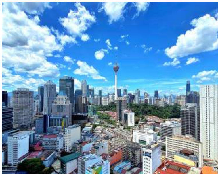
MALAYSIA berjaya meraih komitmen pelaburan RM347 bilion sepanjang lawatan rasmi serta misi perdagangan dan pelaburan di luar negara. - Gambar hiasan

Sudah semestinya tugas PM adalah untuk bertemu dengan pemimpin dunia dalam sesi kunjungan hormat lawatan kerja beliau ke negara luar. Dalam masa yang sama, beliau turut membawa masuk pelabur ke Malaysia