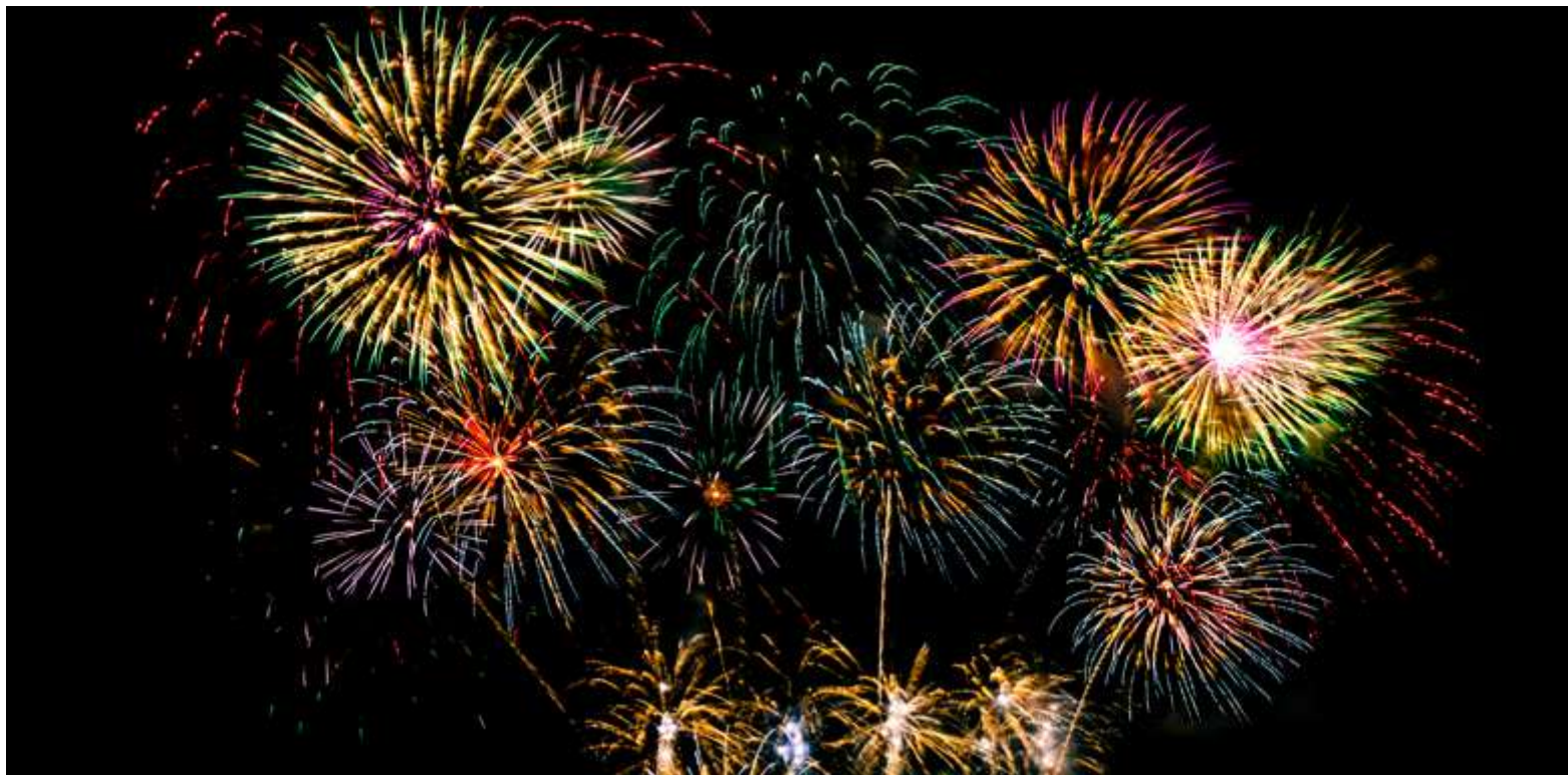
KETIADAAN acara yang menjurus keseronokan dan kepestaan itu telah memberi ruang meningkatkan keinsafan kita dalam menjalani kehidupan. - Gambar hiasan

Begitu juga pada akhir Disember 2021, tidak diadakan sambutan tahun baharu di Kuala Lumpur seperti sebelumnya juga sebagai tanda simpati dengan mangsa banjir besar yang melanda beberapa negeri ketika itu. Semua itu adalah tindakan yang menampakkan kemanusiaan diletakkan di tempat