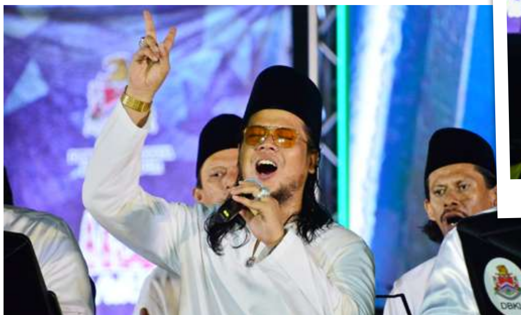
SELEBRITI jemputan Bienda turut menghiburkan pengunjung yang hadir bersama barisan artis yang terlibat.