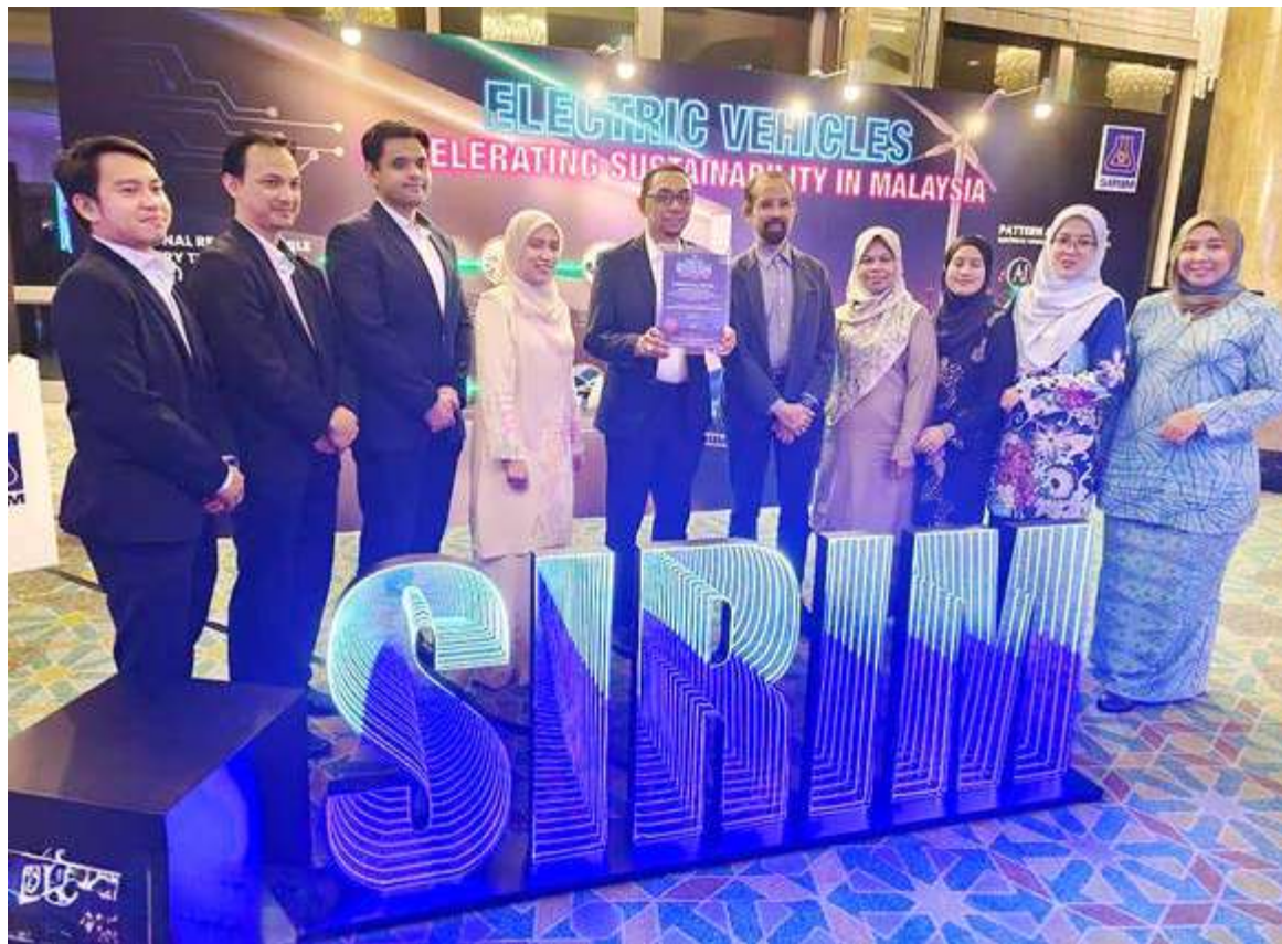
ANTARA wakil PPj yang hadir menerima sijil penghargaan pencapaian pensijilan ISMS baru-baru ini.

Dalam masa sama, Fadlun berkata objektif pensijilan tersebut adalah untuk mengurus dan melindungi keselamatan maklumat bagi Sistem Kewangan