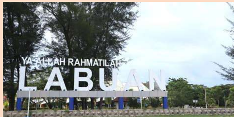
LABUAN memiliki pelbagai tarikan tersendiri.

Mengulas lanjut, Rithuan berkata dengan kemajuan industri pelancongan pada hari ini, ia mampu memacu ekonomi pelbagai sektor pembangunan di pulau tersebut lebih-lebih lagi Labuan juga dikenali sebagai hab logistik, industri minyak dan gas selain Hab Kewangan Islam Antarabangsa. WK