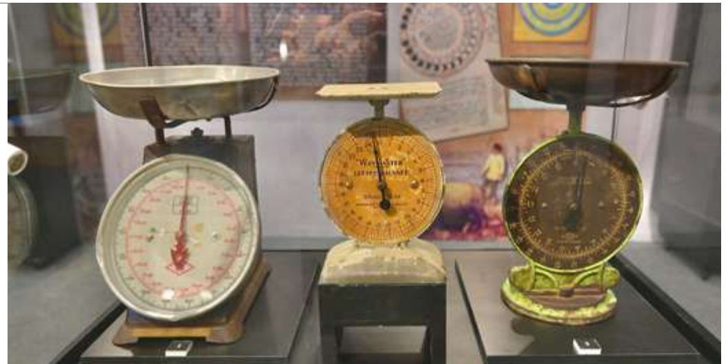
ANTARA alat timbang dan sukat yang digunakan pada zaman dahulu sehingga kini bagi mengukur isi padu, barangan dan sebagainya.