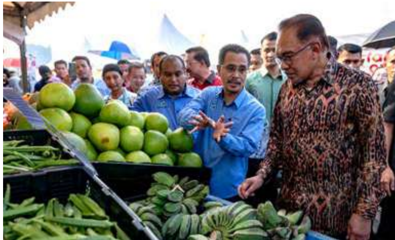
ANWAR sentiasa turun padang meninjau keadaan rakyat. - Gambar hiasan

Sekarang ini, kerajaan dengan kerjasama badan-badan penyelidik termasuk Universiti Putra Malaysia (UPM) sedang membuat kajian dan perancangan terperinci untuk mengeluarkan baka ayam daging dan telur sendiri dengan kerjasama dari Indonesia.