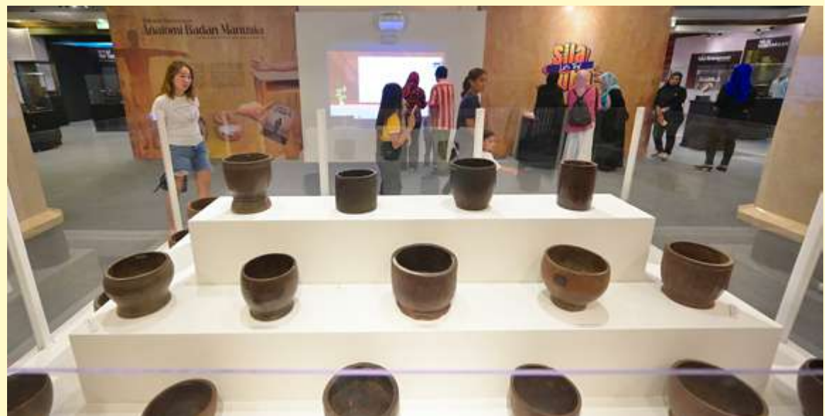
30 koleksi gantang dalam pelbagai jenis saiz, berat dan nilai dipamerkan di perkarangan pameran tersebut.

Jelas Hanisah, penggunaan gantang dalam kalangan masyarakat dahulu amat penting dan bermanfaat malah kehidupan