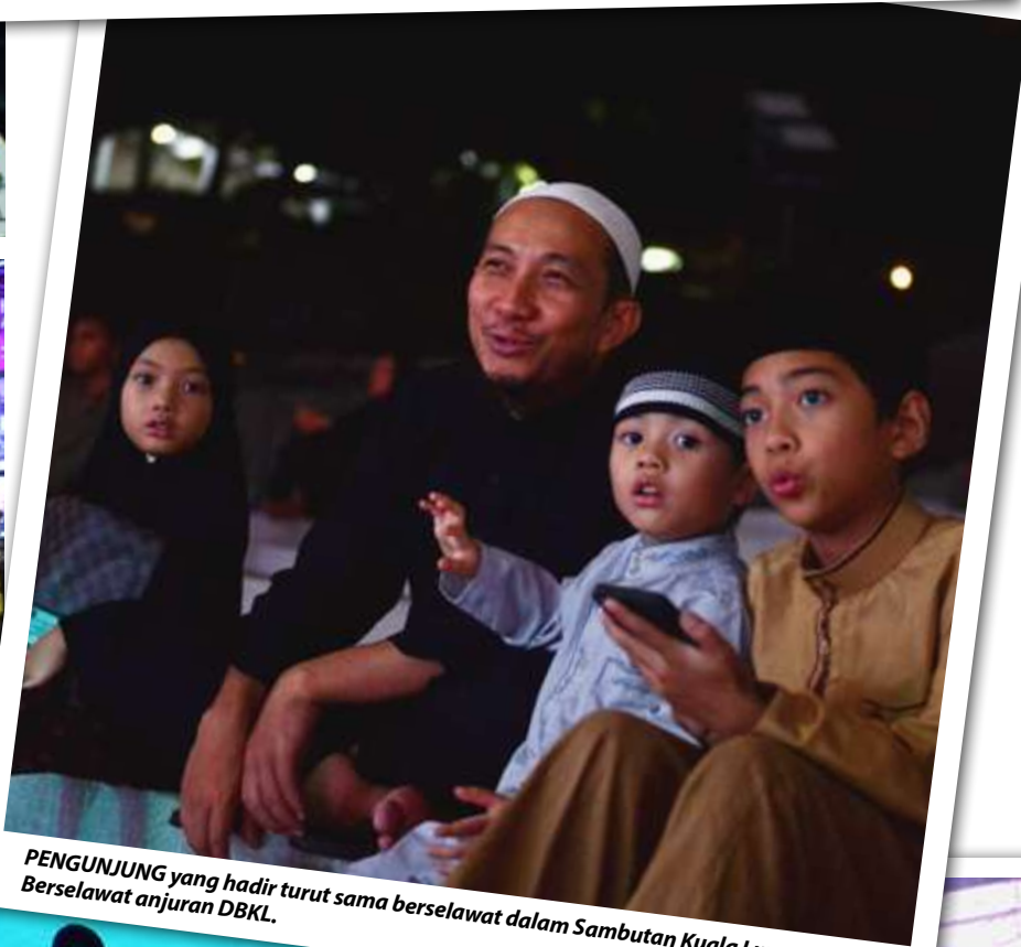
PENGUNJUNG yang hadir turut sama berselawat dalam Sambutan Kuala Lumpur Berselawat anjuran DBKL.