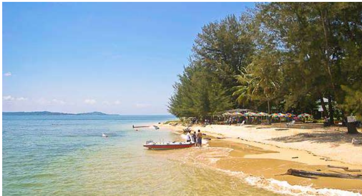
PULAU Papan merupakan salah satu pulau indah yang terdapat di Labuan. - Gambar hiasan

"Selain itu, Labuan juga dikenali sebagai pusat aktiviti sukan laut bertaraf antarabangsa seperti Labuan International Sea Challenge yang telah menjadi sukan tahunan dan mendapat penyertaan menggalakkan dari negara luar,"